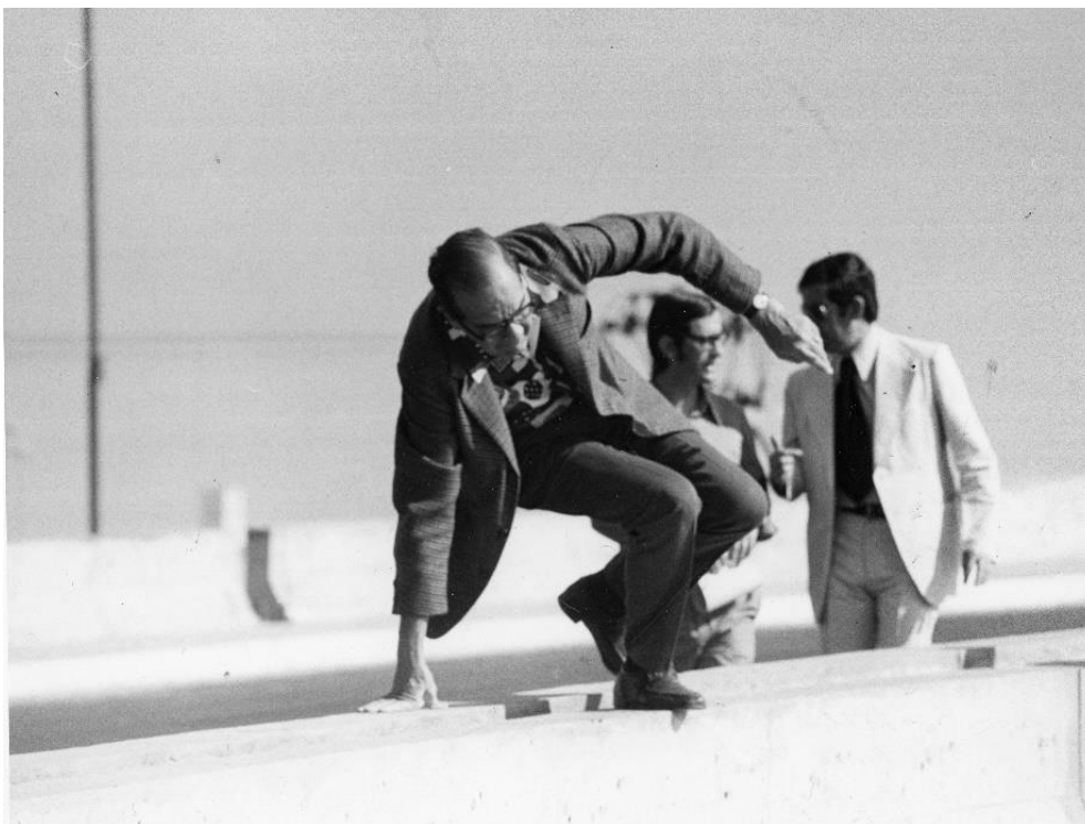
02. Prefeito Olavo Setubal, durante vistoria em obras no Viaduto Tatuapé. Abril de 1975.