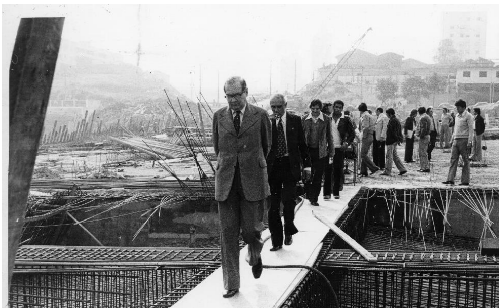
03. Prefeito Olavo Setubal, acompanhado de assessores, durante vistoria das obras da Avenida Sumaré com a Avenida Brasil. Junho de 1979.